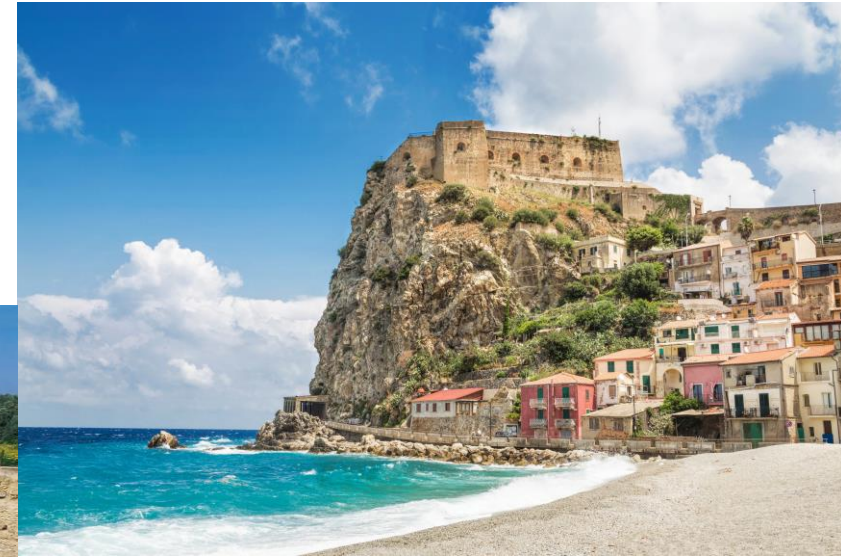
Château de Scilla