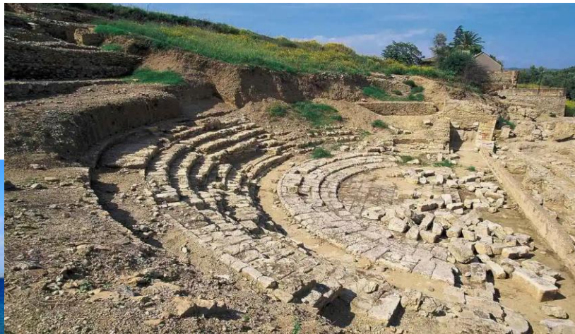
Roccelleta di borgia